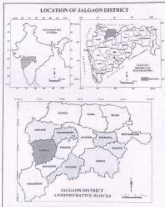
Fig. No. 1